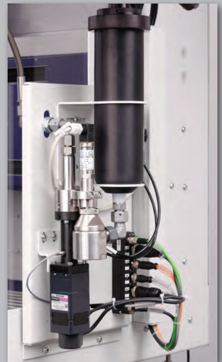
E-KDP 3 mit Kartusche