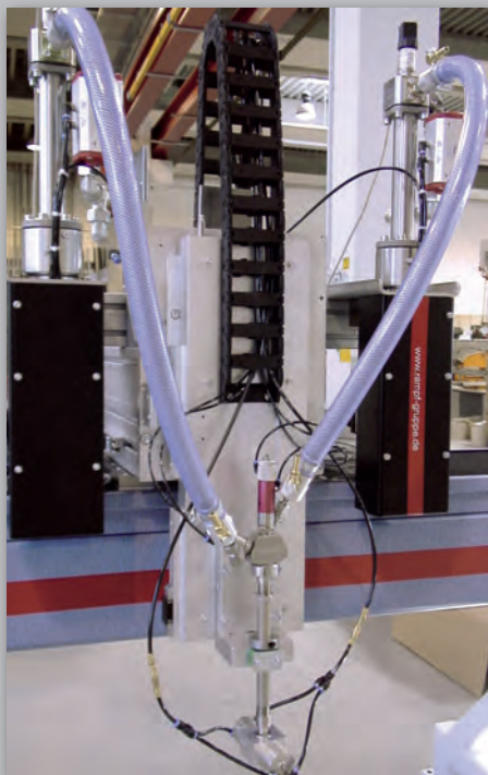
E-KDP 250 mit Statikmischer

Die Servoantriebstechnik ermöglicht einen geschwindigkeitsvariablen Materialausstoß und damit die Einstellung von beliebigen Mischungsverhältnissen bei 2K-Materialien. Die optimale Anpassung an die Prozessbedingungen wird durch das servoelektrische Übersetzungsprinzip abgerundet.