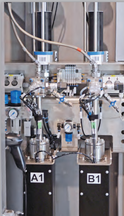
E-KDP 63 mit Kartuschen